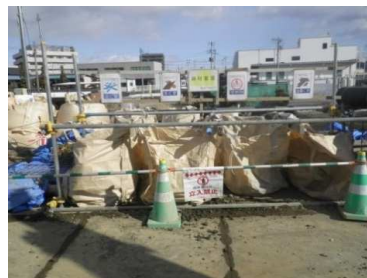
一般・建設廃棄物分別

株式会社 泉工務店 仙台市泉区八乙女中央四丁目8-16 TEL 022-373-47865 FAX 022-375-3555