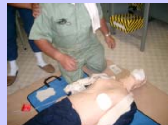
地元消防署の協力を得て非常時訓練の実施。AEDを使用。