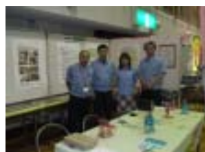
柴田町環境フェア